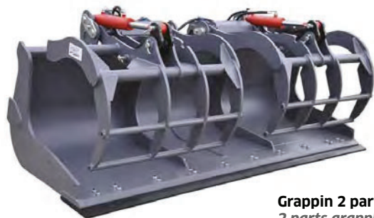
Grappin 2 parties 2 parts grapple

BMF.SDR Benne avec grappin GRL.S.2E.2P (dents affleurantes) Bucket with grapple GRL.S.2E.2P (flush teeth)