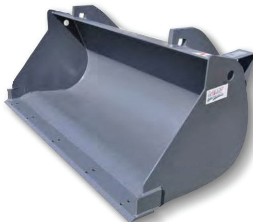
Lame percée Pierced blade

Ideal for the recovery of all types of materials (sand, earth, embankments) - power from 80 to 120 hp