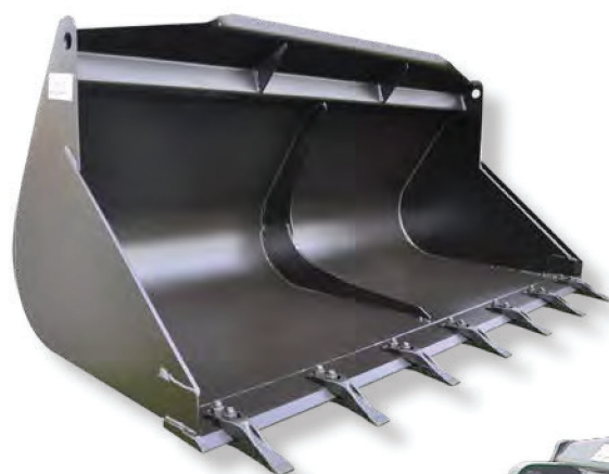
avec dents With teeth

Reinforced range - power from 100 to 140 hp