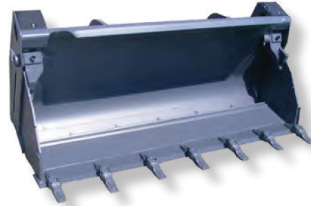
Avec kit porte dents soudés With welded teeth holder kit

Contre-lame réversible reversible counter plate