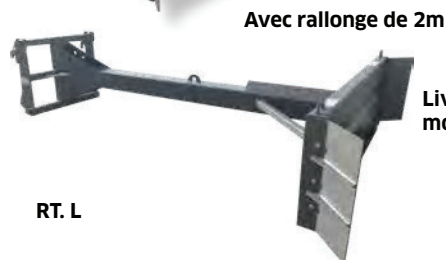
Avec rallonge de 2m