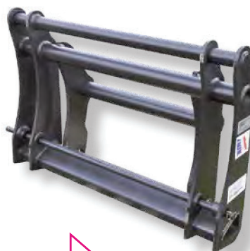
Par la reprise de différents accrochages